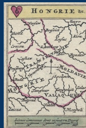
Igraće karte, oko 1710. Privatna zbirka Dr. Ovidiu Șandora, Temišvar

Izložba prikazuje razvoj kartografije dunavskog područja od 1650. do 1800. godine na temelju 70 vrijednih eksponata, koji su prvi put izloženi. Temelj prezentacije čini opsežna zbirka karata i planova koju su badenski markgrofovi izradili u vojne svrhe. Eksponati iz zbirke Instituta za podunavsku švapsku povijest i regionalnu znanost u Tübingenu, kao i privatnih donatora, obogaćuju ovu jedinstvenu izložbu.