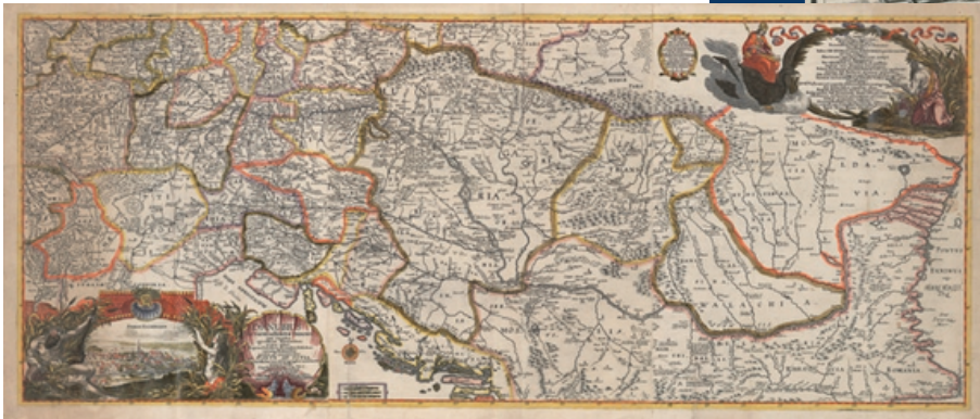
Dunav od izvora do ušća (1683.) Badische Landesbibliothek, Karlsruhe

Na suptilan su način, novonastale karte Dunava legitimirale vladarske pretenzije i kulturne ovisnosti. Slika neprijatelja „poganog i barbarskog Turčina“ brzo se proširila i na taj način. Nije bila zanemariva ni „moć kartografa“ koja je osmislila dunavski prostor.