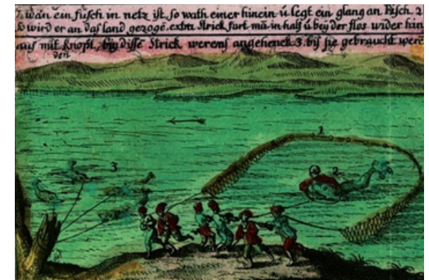
Lov jesetre na Dunavu kod Komárna, nakon 1738. Privatna zbirka Dr. Ovidiu Șandora, Temišvar

Izložba prikazuje razvoj kartografije dunavskog područja od 1650. do 1800. godine na temelju 70 vrijednih eksponata, koji su prvi put izloženi. Temelj prezentacije čini opsežna zbirka karata i planova koju su badenski markgrofovi izradili u vojne svrhe. Eksponati iz zbirke Instituta za podunavsku švapsku povijest i regionalnu znanost u Tübingenu, kao i privatnih donatora, obogaćuju ovu jedinstvenu izložbu.