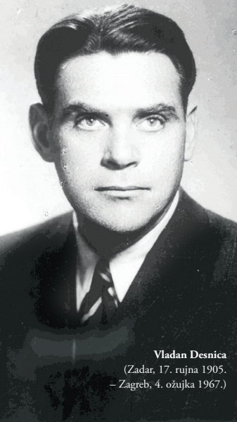
Vladan Desnica (Zadar, 17. rujna 1905. – Zagreb, 4. ožujka 1967.)